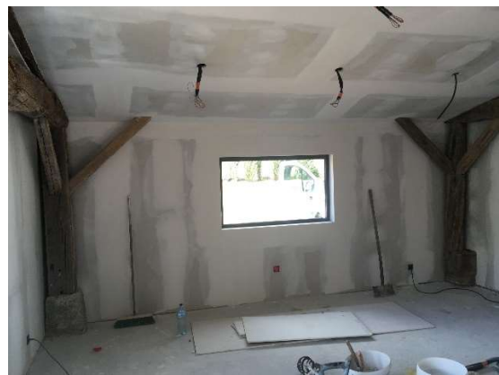
L'extension est plaquée et jointée