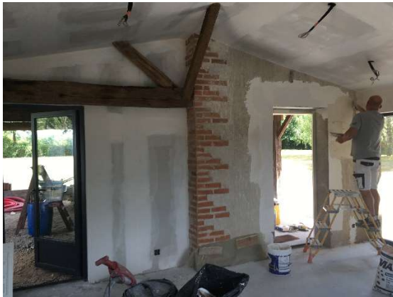
Réalisation de l'enduit à la chaux sur moellon en cours