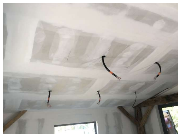
Déploiement des spots de plafond suivant répartition demandée par client